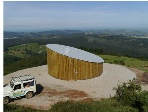
Fotos: Pozo de Nieve de Cartes

El funcionamiento de esta instalación preindustrial requiere unas condiciones climáticas diferentes a las existentes hoy en día. Es por ello, que a los valores culturales propios de este bien, se le suman su elevado interés como registro o testimonio de una climatología diferente a la actual.