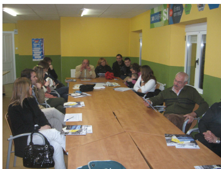
Foto: Foro de participación ciudadana realizado en Cartes

Han sido varios los foros que se han realizado con diversa temática. Estos foros se han dirigido al conjunto de la población, realizando una difusión previa de los mismos a través de diversos carteles que se distribuían en nuestro municipio, web municipal y envío por email a las principales asociaciones existentes.