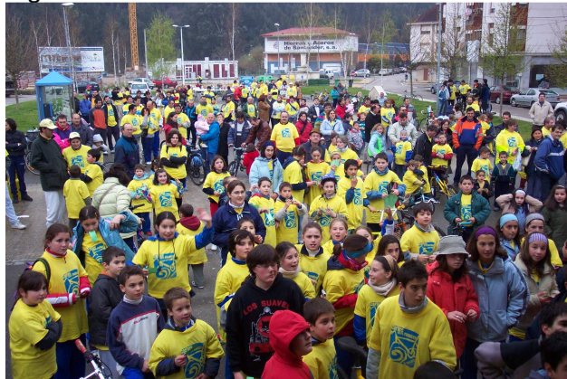
Foto: Día de la Bici en Cartes

Además, hemos de resaltar que Cartes es miembro de la Red de Ciudades por la Bicicleta y es el único municipio de tamaño pequeño que está presente en la junta directiva de esta organización.